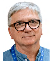
Pepe Fernández Díaz Presidente de Médicos del Mundo

El resumen de la Memoria 2021 recoge de forma exhaustiva la participación y el esfuerzo de nuestra organización por ayudar a las poblaciones que, en cualquier lugar al que tengamos capacidad de acudir, sufran necesidades perentorias de atención médica y de acompañamiento para la protección de sus derechos fundamentales.